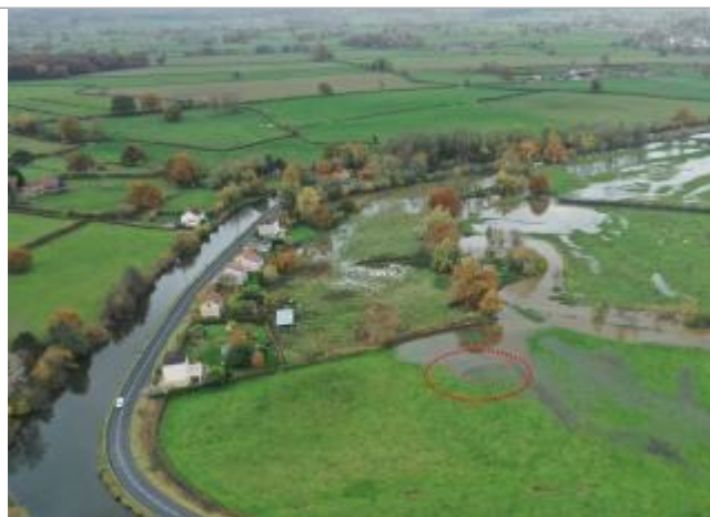
Prise de vue le 15/11/2023 à 12h19