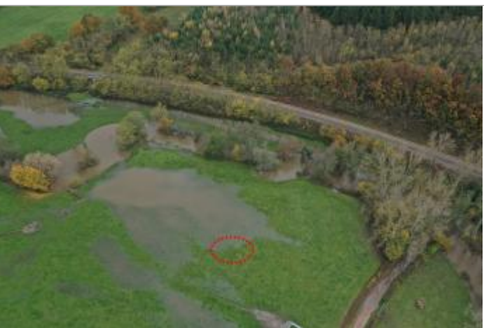
Prise de vue le 15/11/2023 à 12h19