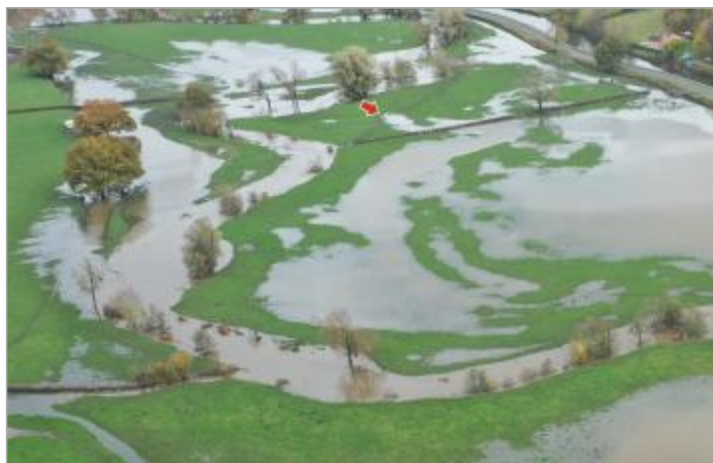
Prise de vue le 15/11/2023 à 12h03