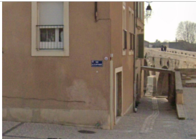
13 rue 22 septembre

Coordonnées WGS84 : X: 3.20947216 / Y: 43.33963590