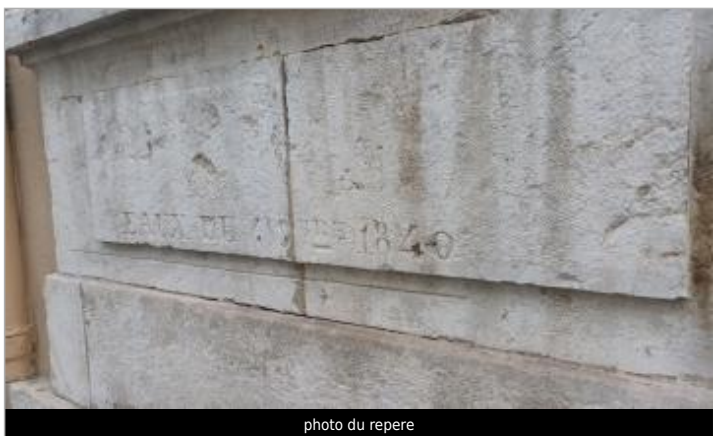
photo du repere