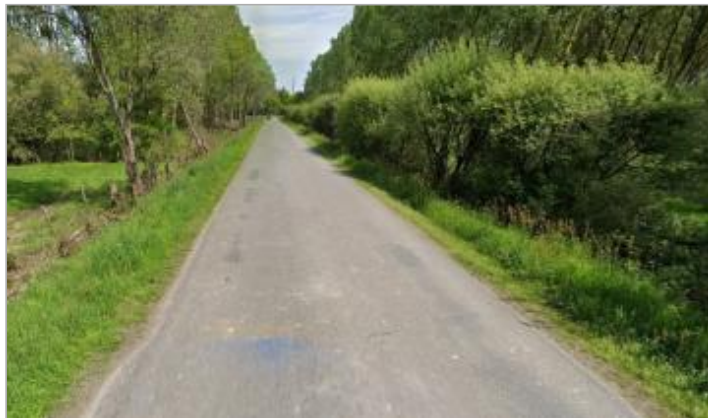
Voie communale entre Saint-Perreux et Allaire