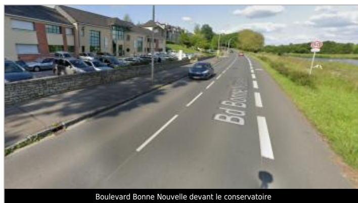
Boulevard Bonne Nouvelle devant le conservatoire

GÉOLOCALISATION Coordonnées WGS84 : X: -2.07907483 / Y: 47.65075150 Coordonnées RGF93 (Lambert 93) X: 318971.51 / Y: 6740077.09 Coordonnées RGF93 (ETRS89) : X: -2.0790748 / Y: 47.6507515 Code Hydro: J---0060 Rive de référence: Droite