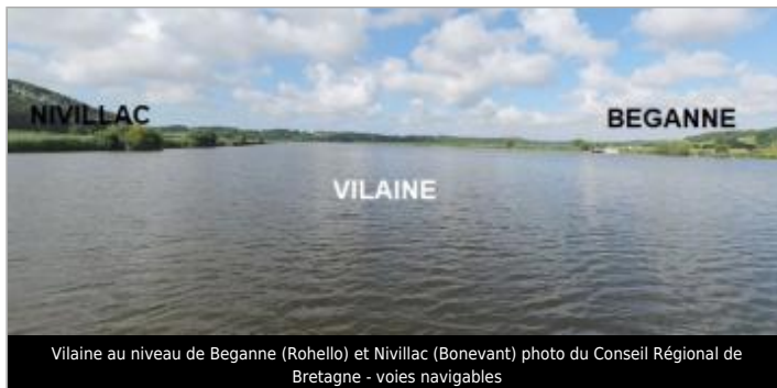
Vilaine au niveau de Beganne (Rohello) et Nivillac (Bonevant)