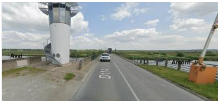
Pont de Cran amont et aval