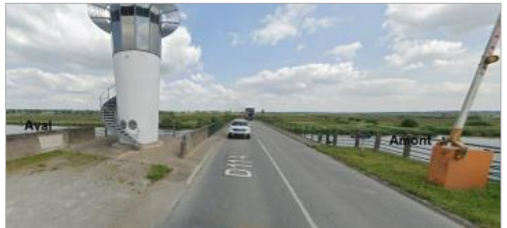
Pont de Cran amont et aval

Coordonnées WGS84 : X: -2.12731839 / Y: 47.58214300