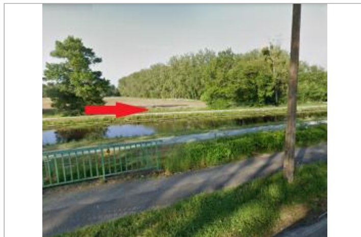
Quai de l'écluse face au magasin de sports

GÉOLOCALISATION Coordonnées WGS84 : X: -2.07478433 / Y: 47.64483320 Coordonnées RGF93 (Lambert 93) X: 319250.7 / Y: 6739400.23 Coordonnées RGF93 (ETRS89) : X: -2.0747843 / Y: 47.6448332 Code Hydro: J---0060 Rive de référence: Gauche