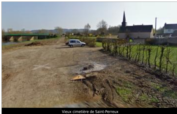
Vieux cimetière de Saint-Perreux

Coordonnées WGS84 : X: -2.10577404 / Y: 47.67686780