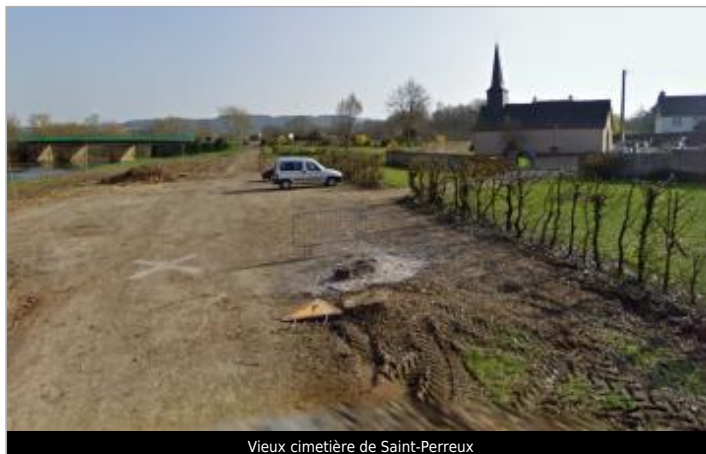
Vieux cimetière de Saint-Perreux