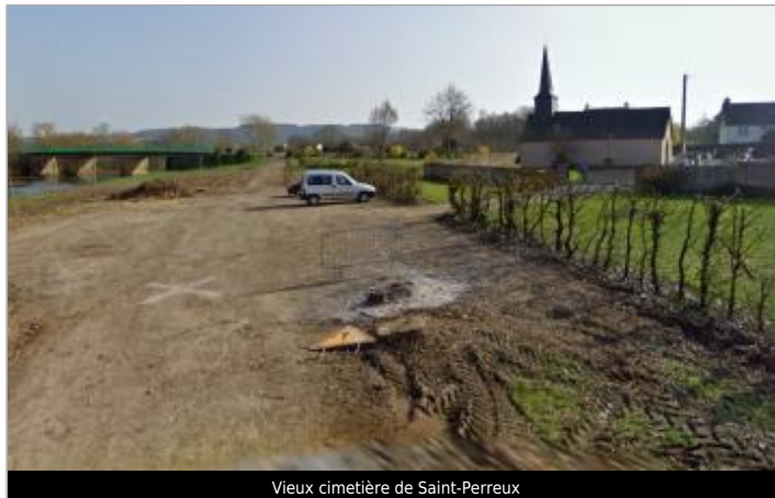
Vieux cimetière de Saint-Perreux