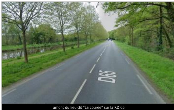
amont du lieu-dit "La courée" sur la RD 65