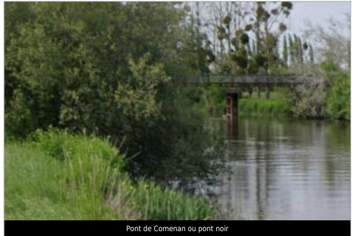
Pont de Comenan ou pont noir