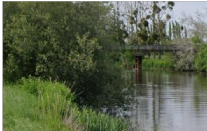
Pont de Comenan ou pont noir

Coordonnées WGS84 : X: -2.10863631 / Y: 47.64200390