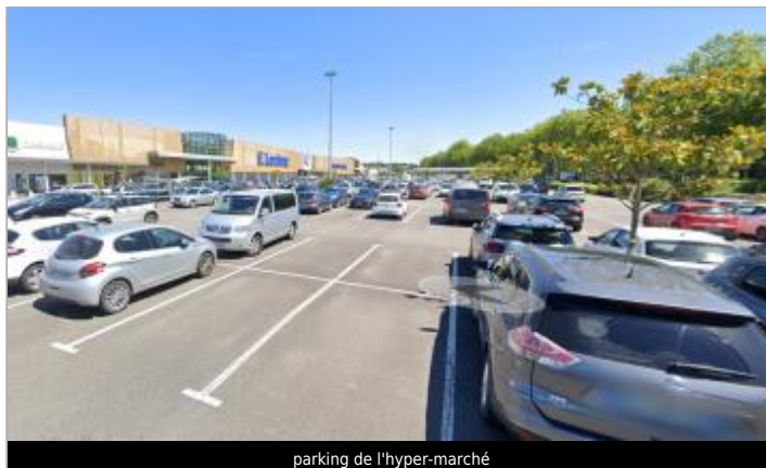
parking de l'hyper-marché