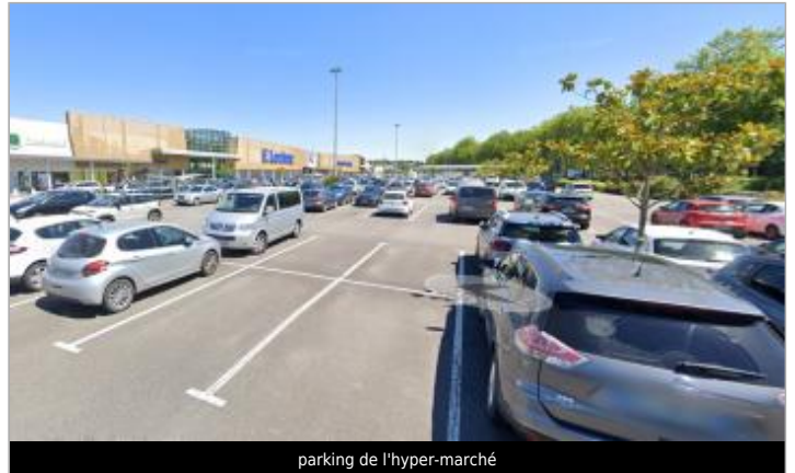
parking de l'hyper-marché