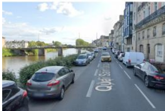
Quai St-Jacques devant le n°9