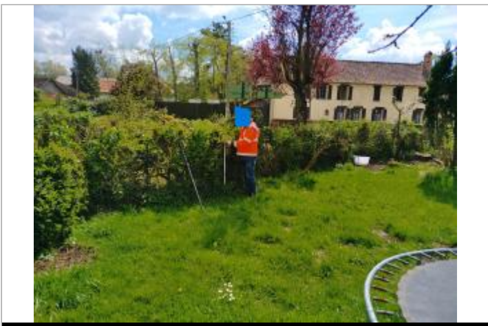
Le site est un poteau métallique.

GÉOLOCALISATION Coordonnées WGS84 : X: 1.85995467 / Y: 50.47776210 Coordonnées RGF93 (Lambert 93) : X: 618958.32 / Y: 7042847.45 Coordonnées RGF93 (ETRS89) : X: 1.8599547 / Y: 50.4777621 Code Hydro: E5410561 Rive de référence: Droite