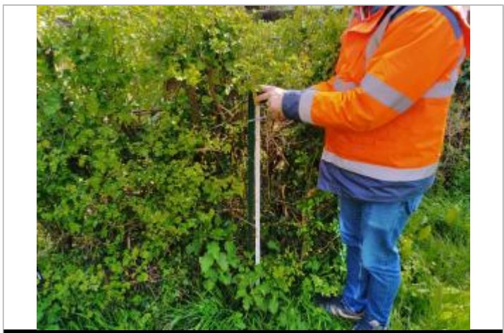
Le repère se trouve sur le poteau d'une clôture.

MARQUE Maximum de l'inondation : Oui Visibilité : Non Repère calculé : Oui PHEC : Oui