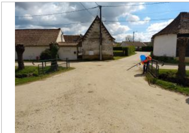
Le site est situé sur une passerelle