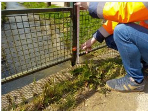
Le repère est localisé sur un garde-corps.

LE NIVELLEMENT A ÉTÉ EFFECTUÉ PAR LE SYMCÉA, QUI N'EST PAS UN EXPERT GÉOMÈTRE. PAR CONSÉQUENT, LA VALEUR INDIQUÉE EST À TITRE INDICATIF. - 18/04/2024