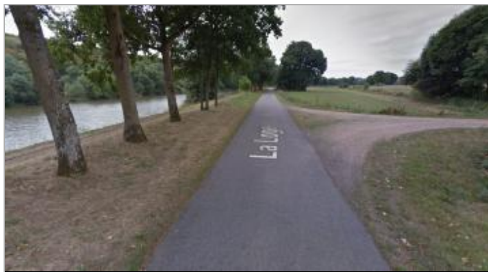
Chemin de halage au niveau de la Loge