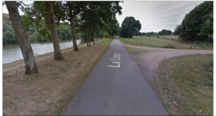
Chemin de halage au niveau de la Loge

Coordonnées WGS84 : X: -1.82714640 / Y: 47.75065220