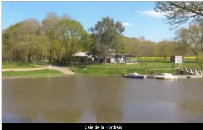
Cale de la Hordrais