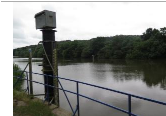
Echelle de la station hydrométrique de Eaux &amp; Vilaine (EPTB Vilaine)