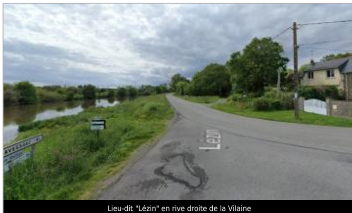
Lieu-dit "Lézin" en rive droite de la Vilaine

Coordonnées WGS84 : X: -1.96263056 / Y: 47.67156470