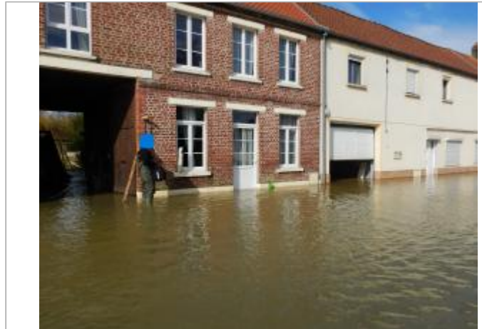
Le site est le mur d'une maison privée.

Coordonnées WGS84 : X: 1.77353802 / Y: 50.47238450