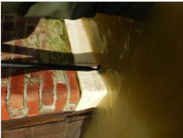
Le repère est situé au pied du mur d'une maison privée.

Altitude calculée de l'eau (en m) : 6.57