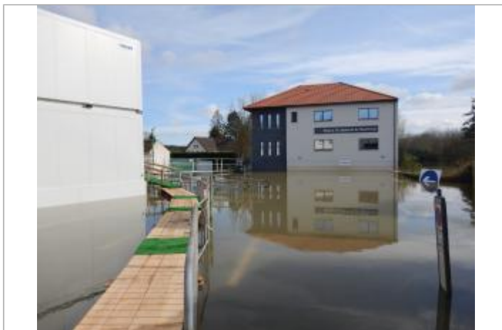
Le site est la première marche d'un escalier.