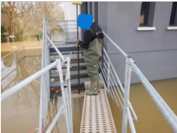
Le repère est localisé au pied d'escalier d'une maison de santé.

LE NIVELLEMENT A ÉTÉ EFFECTUÉ PAR LE SYMCEA, QUI N'EST PAS UN EXPERT GÉOMÈTRE. PAR CONSÉQUENT, LA VALEUR INDIQUÉE EST À TITRE INDICATIF. - 27/02/2024