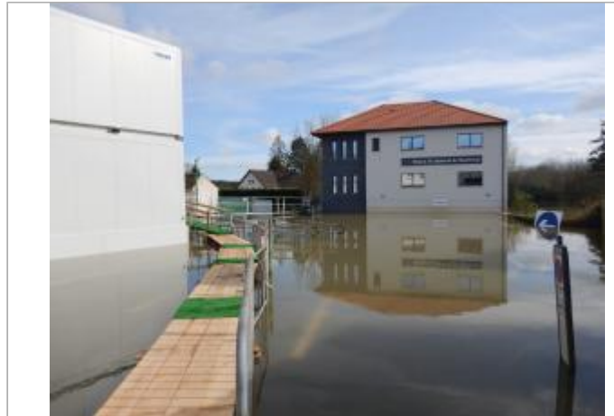
Le site est la première marche d'un escalier.

Coordonnées WGS84 : X: 1.77381921 / Y: 50.47204910