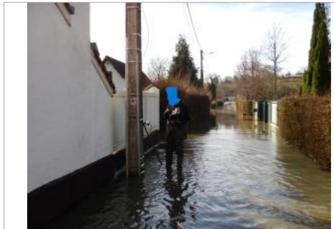
Le site est un poteau électrique

Coordonnées WGS84 : X: 1.79948977 / Y: 50.45873330