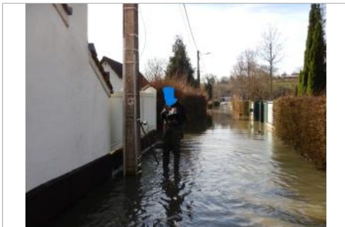
Le site est un poteau électrique