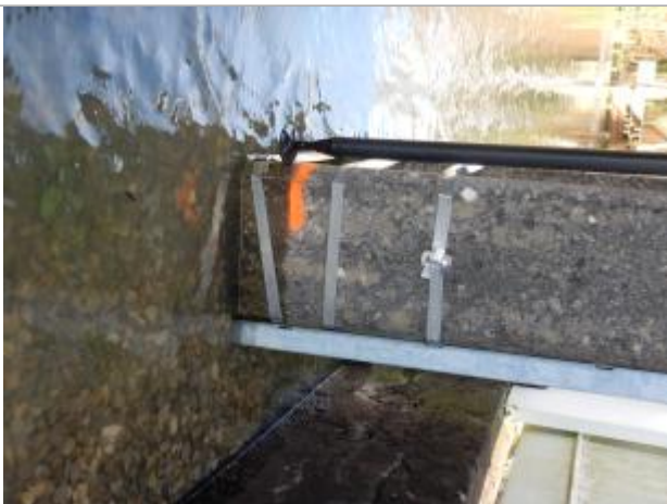
Le repère est localisé au pied d'un poteau électrique.

Visibilité : Oui État du repère : Moyen Pérennité : Moyenne Repère calculé : Oui