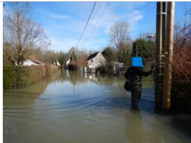
Le site est un poteau électrique.