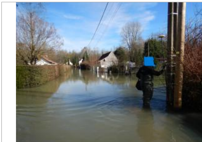
Le site est un poteau électrique.

Coordonnées WGS84 : X: 1.79899597 / Y: 50.45805830