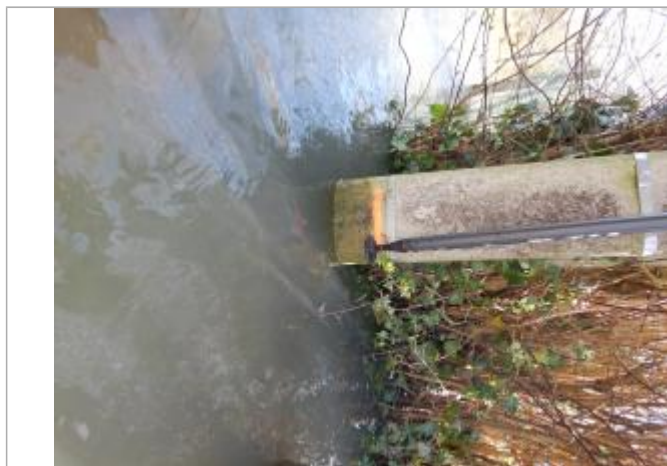
Le repère est au pieds d'un poteau électrique

LE NIVELLEMENT A ÉTÉ EFFECTUÉ PAR LE SYMCÉA, QUI N'EST PAS UN EXPERT GÉOMÈTRE. PAR CONSÉQUENT, LA VALEUR INDIQUÉE EST À TITRE INDICATIF. - 27/02/2024