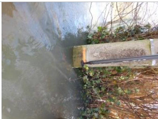
Le repère est au pieds d'un poteau électrique

Visibilité : Oui État du repère : Moyen Pérennité : Moyenne Repère calculé : Oui