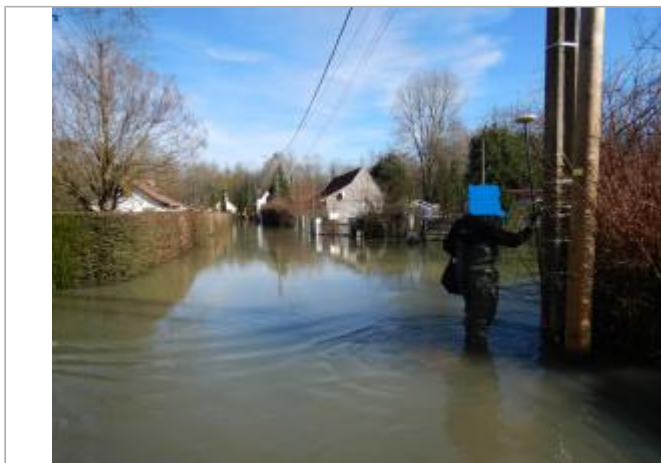
Le site est un poteau électrique.