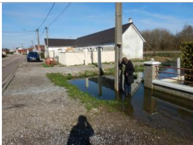
Le repère se trouve sur un poteau électrique.

LE NIVELLEMENT A ÉTÉ EFFECTUÉ PAR LE SYMCÉA, QUI N'EST PAS UN EXPERT GÉOMÈTRE. PAR CONSÉQUENT, LA VALEUR INDIQUÉE EST À TITRE INDICATIF. - 27/02/2024