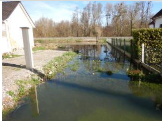
Le site est un poteau électrique en béton