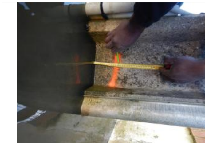
Le repère se trouve au pied d'un poteau électrique

LE NIVELLEMENT A ÉTÉ EFFECTUÉ PAR LE SYMCÉA, QUI N'EST PAS UN EXPERT GÉOMÈTRE. PAR CONSÉQUENT, LA VALEUR INDIQUÉE EST À TITRE INDICATIF. - 27/02/2024