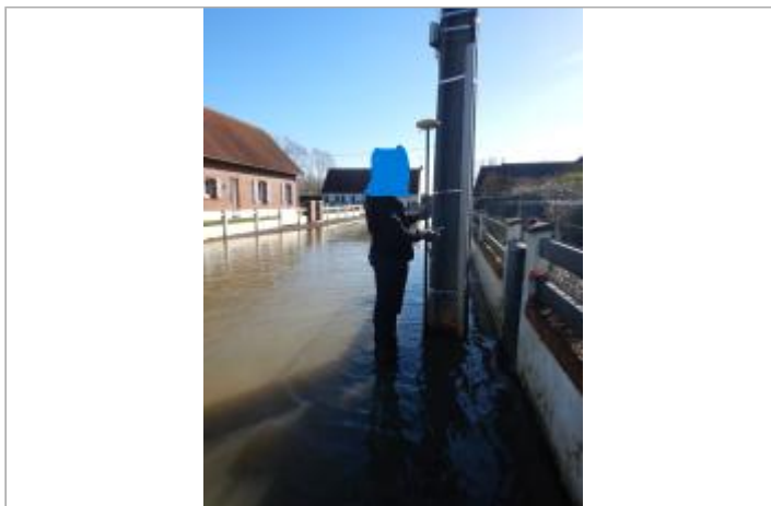
Le site est un poteau électrique.

Coordonnées WGS84 : X: 1.83134406 / Y: 50.44937550