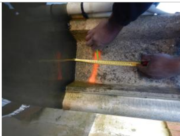
Le repère se trouve au pied d'un poteau électrique

LE NIVELLEMENT A ÉTÉ EFFECTUÉ PAR LE SYMCÉA, QUI N'EST PAS UN EXPERT GÉOMÈTRE. PAR CONSÉQUENT, LA VALEUR INDIQUÉE EST À TITRE INDICATIF. - 27/02/2024