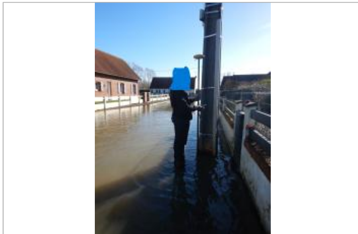
Le site est un poteau électrique.