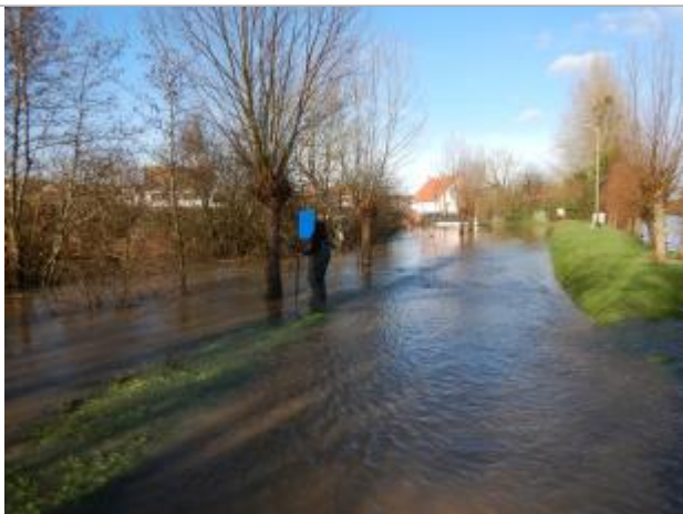
Le repère est au niveau de la surface du Clair Vignon.

Altitude calculée de l'eau (en m) : 8.82