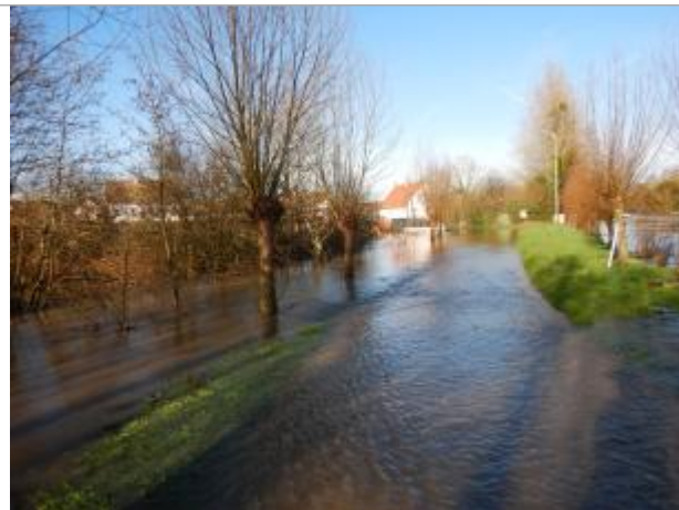
Le site est situé à la surface du Clair Vignon.