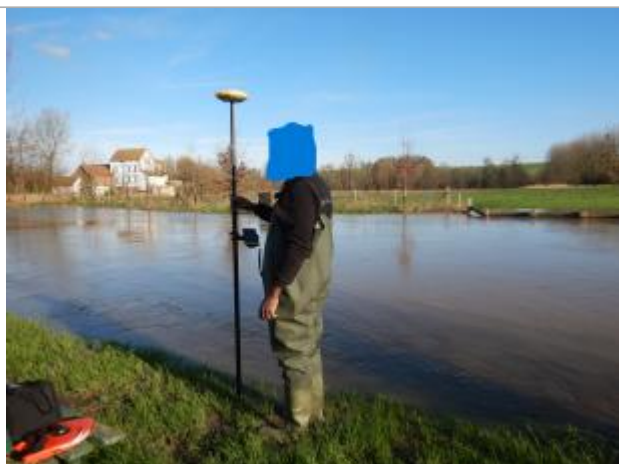
Le repère est une portion, à ras du sol sur la berge gauche de La Canche.

LE NIVELLEMENT A ÉTÉ EFFECTUÉ PAR LE SYMCÉA, QUI N'EST PAS UN EXPERT GÉOMÈTRE. PAR CONSÉQUENT, LA VALEUR INDIQUÉE EST À TITRE INDICATIF. - 27/02/2024