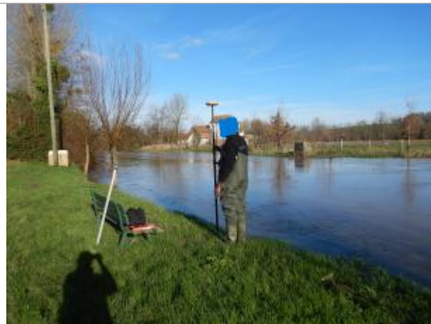
Le site est un point de la berge gauche de La Canche.