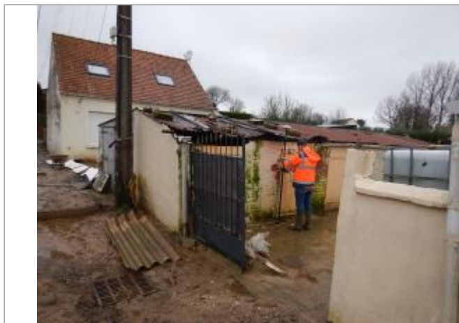
Le site est au pied du mur d'une maison privée.