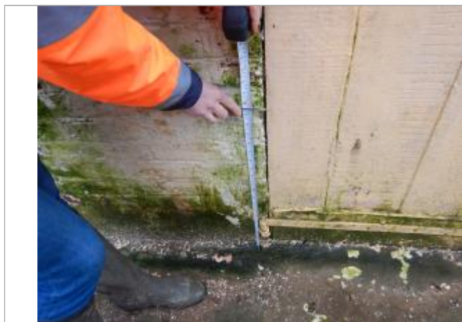
Le repère est sur le mur d'un maison privée.

LE NIVELLEMENT A ÉTÉ EFFECTUÉ PAR LE SYMCÉA, QUI N'EST PAS UN EXPERT GÉOMÈTRE. PAR CONSÉQUENT, LA VALEUR INDIQUÉE EST À TITRE INDICATIF. - 08/02/2024