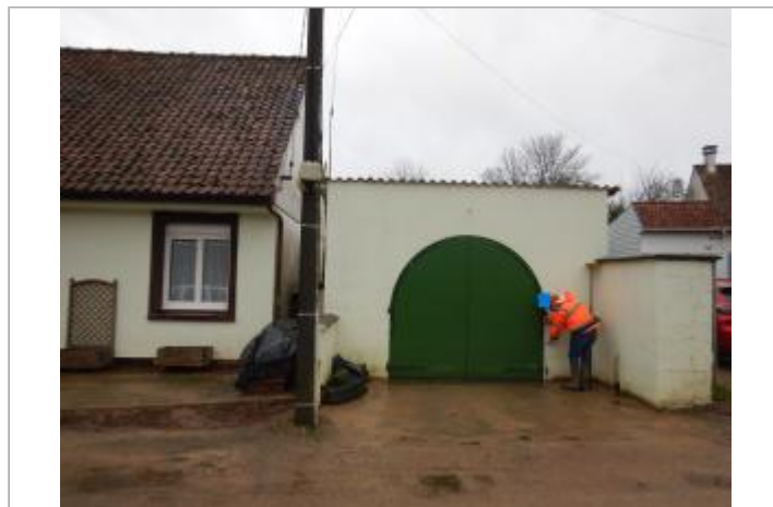
Le site est une porte d'entrée d'un garage privé.

GÉOLOCALISATION Coordonnées WGS84 : X: 1.73012429 / Y: 50.52988600 Coordonnées RGF93 (Lambert 93) X: 609823.29 / Y: 7048794.59 Coordonnées RGF93 (ETRS89) : X: 1.7301243 / Y: 50.529886 Code Hydro: E5410750 Rive de référence: