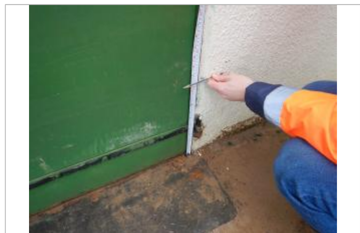
Le repère est localisé au pied d'une porte de garage.

MARQUE Maximum de l'inondation : Oui Visibilité : Non Repère calculé : Oui PHEC : Oui