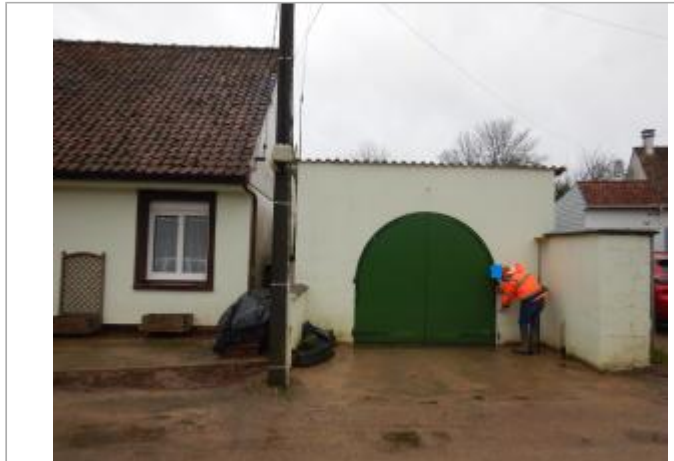
Le site est une porte d'entrée d'un garage privé.

Coordonnées WGS84 : X: 1.73012429 / Y: 50.52988600