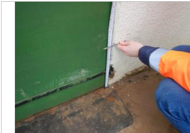
Le repère est localisé au pied d'une porte de garage.

LE NIVELLEMENT A ÉTÉ EFFECTUÉ PAR LE SYMCÉA, QUI N'EST PAS UN EXPERT GÉOMÈTRE. PAR CONSÉQUENT, LA VALEUR INDIQUÉE EST À TITRE INDICATIF. - 08/02/2024