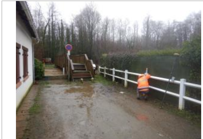
Le site est le poteau en béton d'une clôture.

Coordonnées WGS84 : X: 1.79961289 / Y: 50.45888330