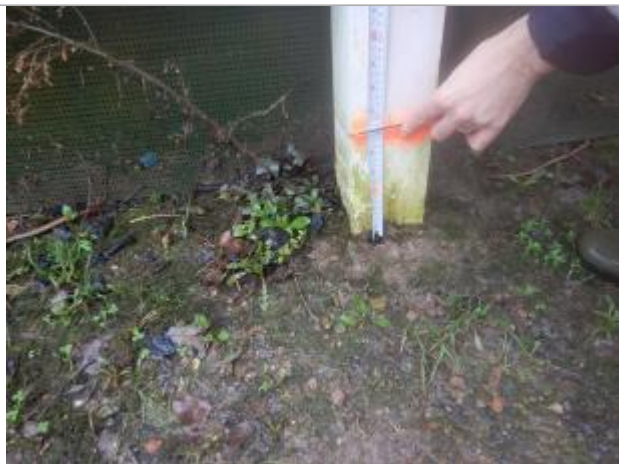
Le repère est au pieds d'un poteau de clôture.

LE NIVELLEMENT A ÉTÉ EFFECTUÉ PAR LE SYMCÉA, QUI N'EST PAS UN EXPERT GÉOMÈTRE. PAR CONSÉQUENT, LA VALEUR INDIQUÉE EST À TITRE INDICATIF. - 08/02/2024