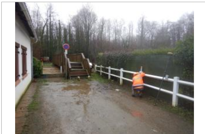
Le site est le poteau en béton d'une clôture.