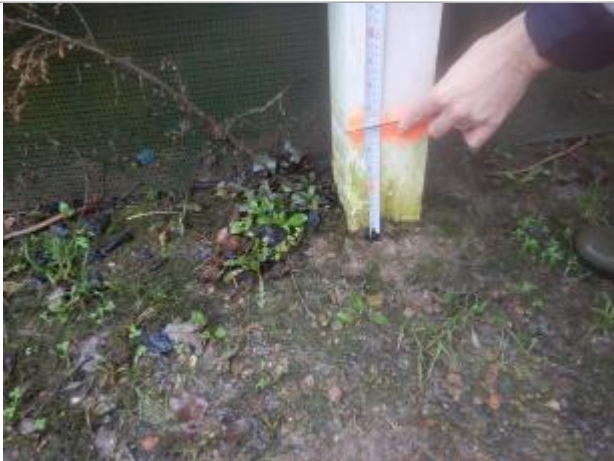
Le repère est au pied d'un poteau de clôture.

LE NIVELLEMENT A ÉTÉ EFFECTUÉ PAR LE SYMCÉA, QUI N'EST PAS UN EXPERT GÉOMÈTRE. PAR CONSÉQUENT, LA VALEUR INDIQUÉE EST À TITRE INDICATIF. - 08/02/2024