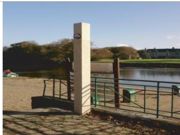
Poteau au Port de Roche