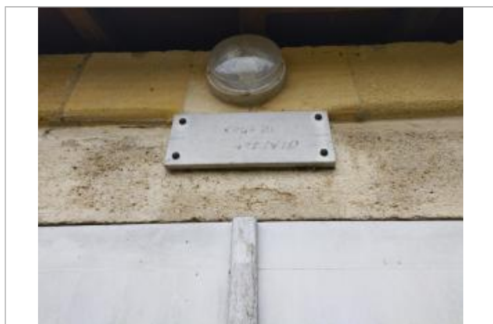
Vue du repère - auteur : UH GAD

Maximum de l'inondation : Oui Visibilité : Oui État du repère : Mauvais Pérennité : Moyenne