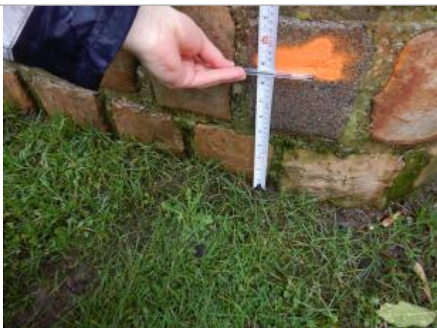
Le repère est localisé sur un poteau en pierre.

Maximum de l'inondation : Non renseigné Visibilité : Oui État du repère : Moyen Pérennité : Moyenne Repère calculé : Oui PHEC : Non renseigné