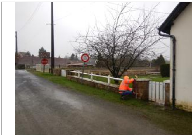
Le site est un poteau en pierre, à l'entrée d'une maison privée.

Coordonnées WGS84 : X: 1.80220130 / Y: 50.45523240 Coordonnées RGF93 (Lambert 93) X: 614815.08 / Y: 7040398.65 Coordonnées RGF93 (ETRS89) : X: 1.8022013 / Y: 50.4552324 Code Hydro : E54-003- Rive de référence : Gauche