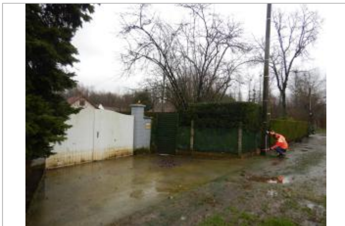
Le site est un poteau électrique.