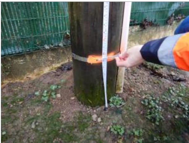
Le repère est au pieds d'un poteau électrique en bois.

Maximum de l'inondation : Non renseigné Visibilité : Oui État du repère : Moyen Pérennité : Moyenne Repère calculé : Oui PHEC : Non renseigné