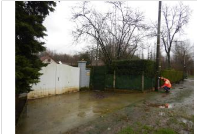
Le site est un poteau électrique.

Coordonnées WGS84 : X: 1.79871548 / Y: 50.45816010 Coordonnées RGF93 (Lambert 93) : X: 614572.16 / Y: 7040728.53 Coordonnées RGF93 (ETRS89) : X: 1.7987155 / Y: 50.4581601 Code Hydro: E54-003- Rive de référence: Gauche