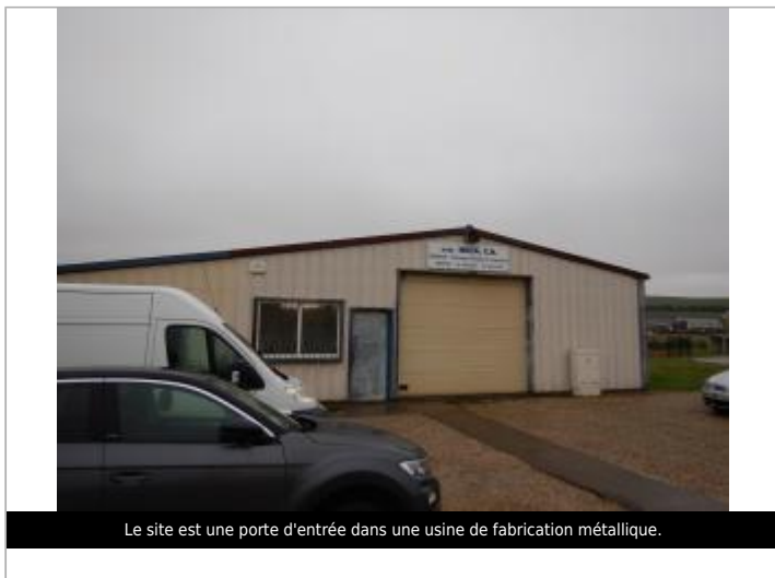
Le site est une porte d'entrée dans une usine de fabrication métallique.