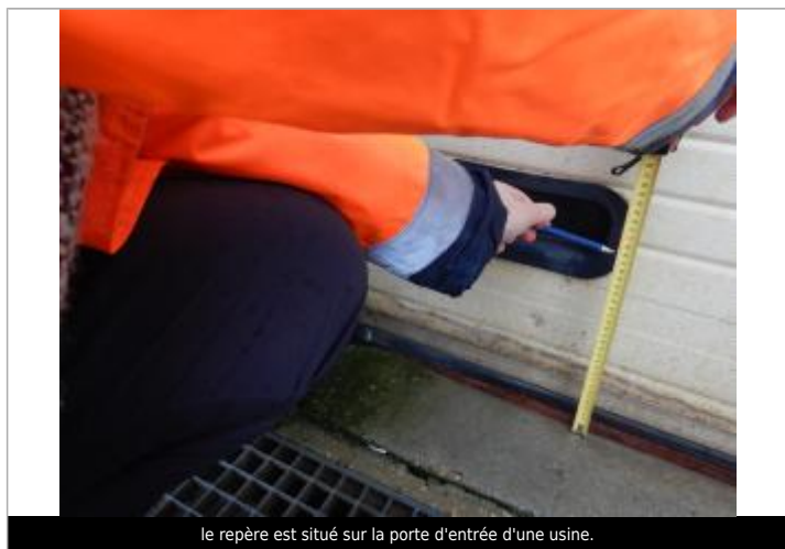
le repère est situé sur la porte d'entrée d'une usine.

Maximum de l'inondation : Non renseigné Visibilité : Non Repère calculé : Oui PHEC : Non renseigné