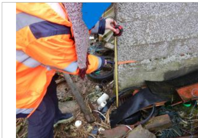
Le repère est un mur en parpaing.

LE NIVELLEMENT A ÉTÉ EFFECTUÉ PAR LE SYMCÉA, QUI N'EST PAS UN EXPERT GÉOMÈTRE. PAR CONSÉQUENT, LA VALEUR INDIQUÉE EST À TITRE INDICATIF. - 07/02/2024