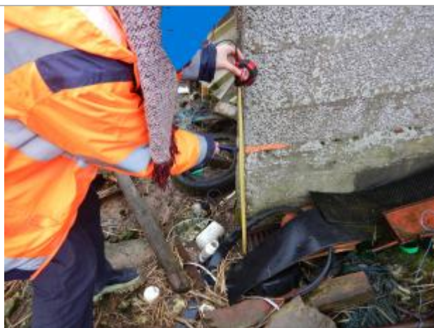
Le repère est un mur en parpaing.

LE NIVELLEMENT A ÉTÉ EFFECTUÉ PAR LE SYMCÉA, QUI N'EST PAS UN EXPERT GÉOMÈTRE. PAR CONSÉQUENT, LA VALEUR INDIQUÉE EST À TITRE INDICATIF. - 07/02/2024