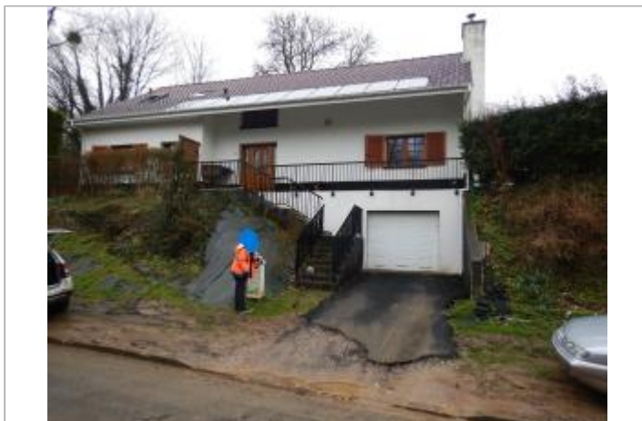
Le site est une boîte aux lettres.