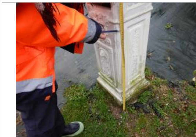
Le repère est situé sur une boîte aux lettres.

LE NIVELLEMENT A ÉTÉ EFFECTUÉ PAR LE SYMCÉA, QUI N'EST PAS UN EXPERT GÉOMÈTRE. PAR CONSÉQUENT, LA VALEUR INDIQUÉE EST À TITRE INDICATIF. - 07/02/2024