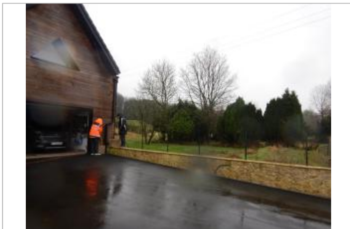
Le site est le mur d'une maison privée.