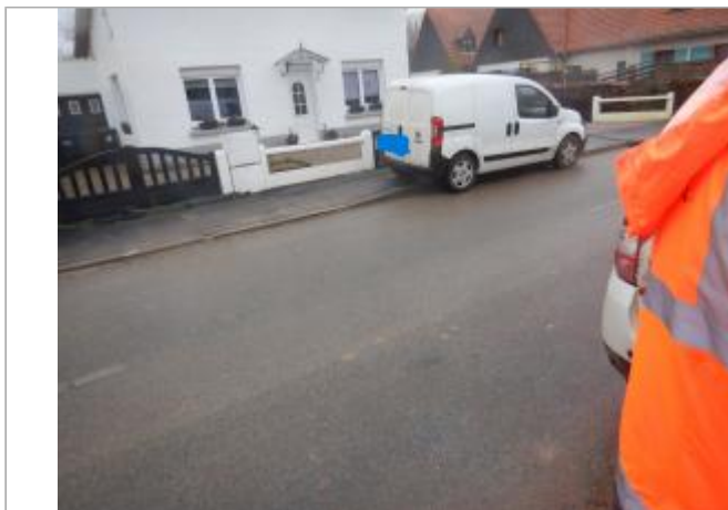
Le site est une clôture en béton.