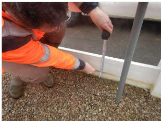
Le repère est situé au pied d'une clôture en béton.

LE NIVELLEMENT A ÉTÉ EFFECTUÉ PAR LE SYMCÉA, QUI N'EST PAS UN EXPERT GÉOMÈTRE. PAR CONSÉQUENT, LA VALEUR INDICQUÉE EST À TITRE INDICATIF. - 02/02/2024