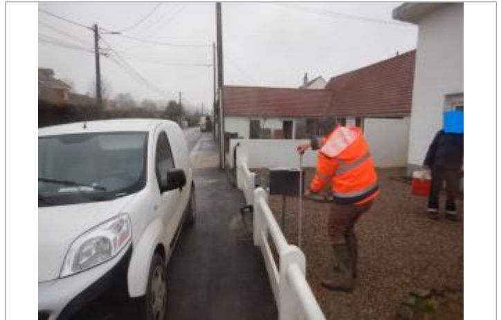
Le site est une boîte à courriers.