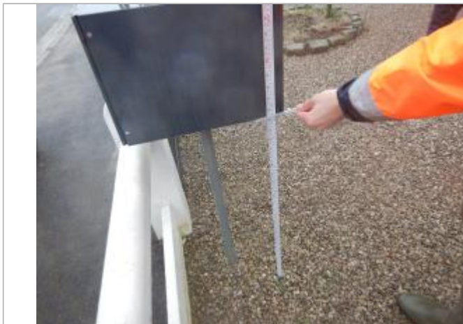
Le repère se trouve sur une boîte à lettre.

Maximum de l'inondation : Oui Visibilité : Oui État du repère : Mauvais PHEC : Oui Repère calculé : Oui