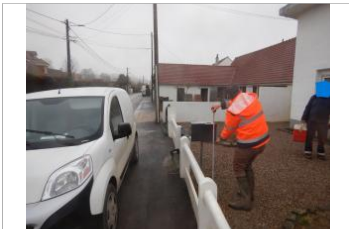
Le site est une boîte à courriers.