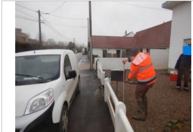
Le site est une boîte à courriers.

Coordonnées WGS84 : X: 1.72897031 / Y: 50.54100270 Coordonnées RGF93 (Lambert 93) : X: 609761.29 / Y: 7050034.3 Coordonnées RGF93 (ETRS89) : X: 1.7289703 / Y: 50.5410027 Code Hydro: E5410750 Rive de référence: Droite