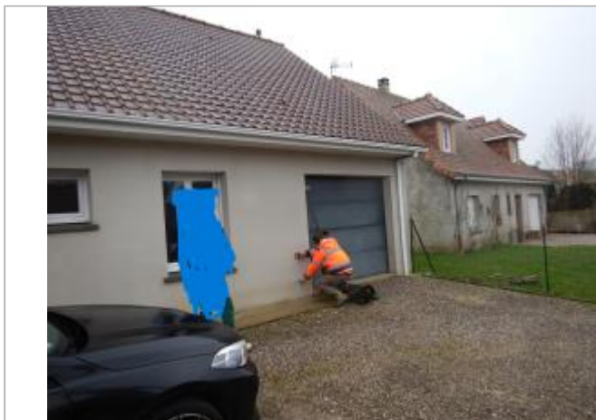
Le site est le mur d'une maison privée.

Coordonnées WGS84 : X: 1.72868407 / Y: 50.54117030